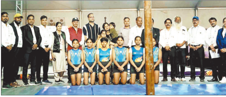
अतिथियों के साथ खिलाड़ी।

महाराष्ट्र की टीम रही द्वितीय, झारखण्ड तीसरे नंबर पर बता दें कि खेलो इंडिया ट्राइबल गेम्स 2026 के तहत सरगुजा में भी कुश्ती दंगल और उसके बाद मल्लखंभ प्रतियोगिता का आयोजन किया। राष्ट्रीय स्तर की मल्लखंभ प्रतियोगिता में देश के 14 राज्यों से टीमों शामिल हुई। मल्लखंभ प्रतियोगिता के अंतर्गत विभिन्न स्पर्धाओं का आयोजन किया गया जिसमें बालक एवं बालिका वर्ग में टीम चैंपियनशिप (पोल एवं रोप मल्लखंभ), पिरामिड चैंपियनशिप तथा पुरुष एवं महिला वर्ग में पिरामिड, पोल एवं रोप मल्लखंभ शामिल हैं। टीम स्पर्धाओं में अधिकतम 6 खिलाड़ियों की भागीदारी निर्धारित की गई थी। प्रतियोगिता का शुभारंभ 2 अप्रैल को किया गया। पहले दिन की प्रतियोगिता में छत्तीसगढ़ ने 124.35 अंक के साथ प्रथम, महाराष्ट्र ने 118.35 अंक के साथ द्वितीय व झारखंड ने 86.95 अंकों के साथ तृतीय स्थान हासिल किया था। इसके साथ ही शुक्रवार को प्रतियोगिता का समापन किया गया। प्रतियोगिता में खिलाड़ियों ने रोप मल्लखंभ, पोल मल्लखंभ, हैंगिंग मल्लखंभ, पिरामिड मल्लखंभ में एक से बढ़कर एक करतब दिखाए। खिलाड़ियों के प्रदर्शन पर वहां मौजूद दर्शकों द्वारा तालियां बजाकर उनका उत्साहवर्धन किया गया। प्रतियोगिता के बाद विजेता टीम घोषित किया गया। समापन के दौरान प्रतिस्पर्धा में छत्तीसगढ़ की बालिका टीम उत्कृष्ट प्रदर्शन के साथ विजेता घोषित की गई। विजेता टीमों को शनिवार को आयोजित मेडल सेरेमनी में मेडल प्रदान किया जाएगा।